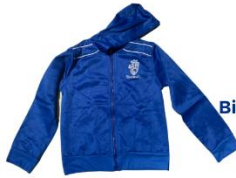
Chaqueta Bien llevada y limpia