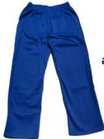
Sudadera Del largo adecuado para evitar que se arrastre y se rompa