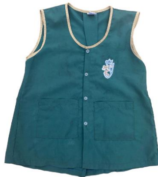
El delantal de las niñas mantendrá el mismo estilo, únicamente cambia la tela (color).