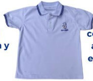
Camisa correspondiente al uniforme de educación física